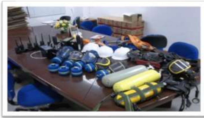
Gambar 2 alat dan bahan fumigasi arsip