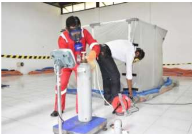
Gambar 4 proses pemasangan alat distribusi SF

Pemasangan alat distribusi gas fumigan SF digunakan untuk menyalurkan gas fumigan SF ke dalam ruang fumigasi arsip. Selang fumigasi arsip harus mampu menahan tekanan sebesar minimal 500 Psi, sehingga dapat mencegah terjadinya selang pecah akibat tekanan gas fumigan SF saat distribusi.