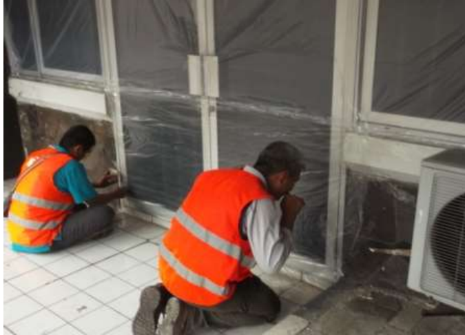
Gambar 5 proses sealing