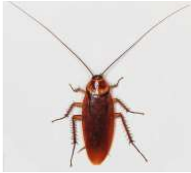
Gambar 27: Kecoa