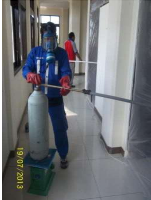
Gambar 7 proses pelepasan sealing