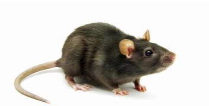
Gambar 28: Tikus

Jumlah telur bervariasi tergantung spesies. Telur diletakkan di dalam ooteka (kapsul telur). Ooteka diletakkan di tempat yang tersembunyi, tetapi pada kecoa jerman ooteka tetap menempel pada tubuh betina sampai menetas. Telur terbentuk dalam dua baris terbungkus dalam kapsul dan telur tersebut berada di bagian belakang perut betina. Kapsul telur nantinya akan dijatuhkan dan dapat menetas dalam satu atau sampai dua bulan kemudian tergantung pada spesiesnya. Nimfa kecoa keluar dari kapsul tidak memiliki sayap dan merangka untuk mencari sumber makanan. Setelah berkembang melalui serangkaian tahapan ( instar ) kecoa akan muncul sebagai kecoa dewasa dan mampu melakukan reproduksi.