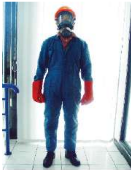
gambar 19 Pakaian full safety

Sarung tangan yang berbahan plastik dan karet tidak dianjurkan digunakan dalam pelaksanaan fumigasi. Untuk lebih jelas pakaian kerja pelaksana fumigasi arsip (fumigator) sebagai berikut ini :