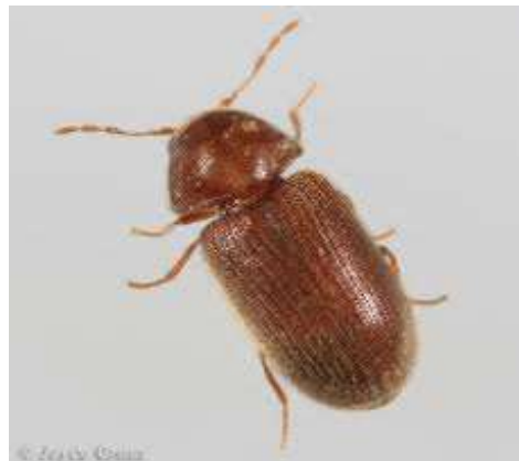
gambar 24 Kumbang penggerek kayu ( Stegobium Paniceum ), Dewasa (kiri) dan larva (kanan)