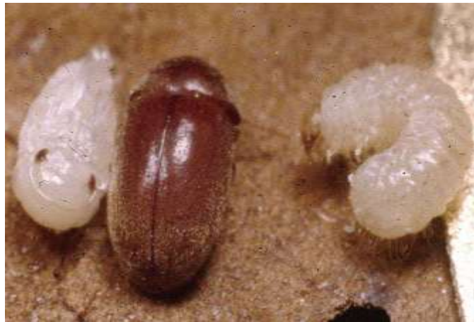
Gambar 22 : Cigarette beetle (Lasioderma serricorne)

Kumbang rokok ( Lasioderma serricorne ) adalah kumbang kecil, berwarna coklat muda, kumbang terbang yang biasanya menyerang buku. Kumbang rokok dewasa berwarna kekuningan hingga coklat kemerahan, berbentuk oval, dan panjang sekitar 0,25 cm. Kepala dibengkokkan ke bawah secara tajam, penampilan bongkok dilihat dari samping. Sayap pelindung ( elytra ) yang halus dan segmen antena yang seragam dan bergigi.