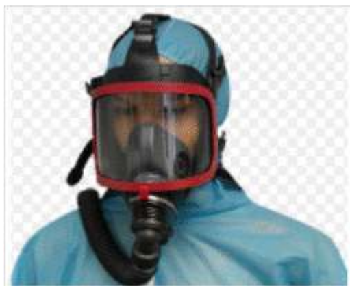
gambar 20 full masker

Fumigator harus menggunakan alat pelindung mata ( full face masker ) untuk menghindari terjadinya iritasi mata akibat paparan gas beracun. Berikut contoh full masker.