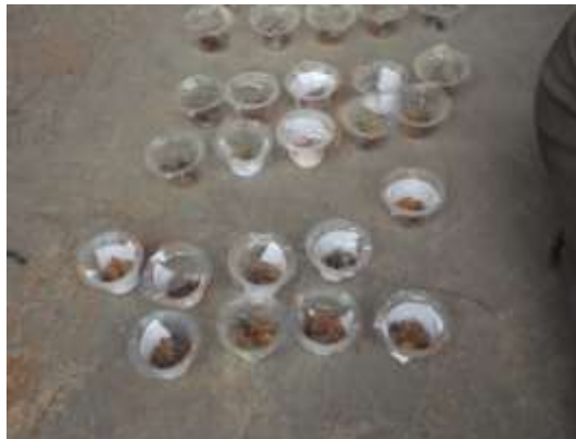
Gambar 6 contoh kontrol biologi

“Jumlah Fumigan yang digunakan = dosis x volume ruangan”.