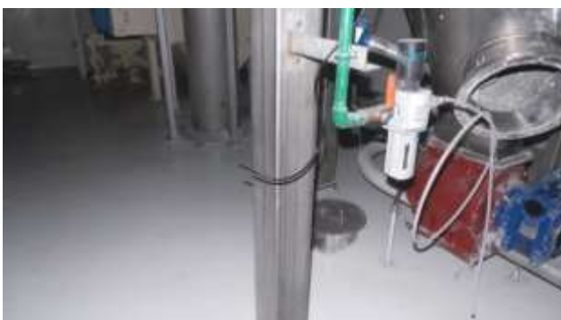
Gambar 3 pemasangan selang monitoring

Pemasangan selang monitoring berguna untuk mengambil sampel konsentrasi gas dalam ruangan.