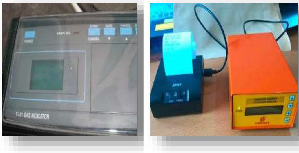
gambar 15 alat pengukur konsentrasi gas

Digunakan ketika proses pelaksanaan fumigasi arsip. Alat ini penting untuk mengukur konsentrasi gas fumigan di ruang fumigasi arsip. Alat pengukur konsentrasi gas dilakukan secara berkala selama paparan fumigan.