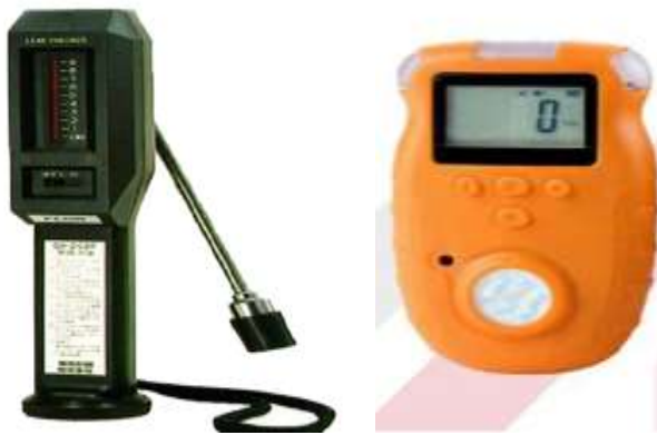
gambar 14 alat pendeteksi kebocoran gas

kebocoran penting digunakan untuk mengetahui titik lokasi kebocoran fumigan agar dilakukan perbaikan atau penambalan kebocoran ruang fumigasi arsip.