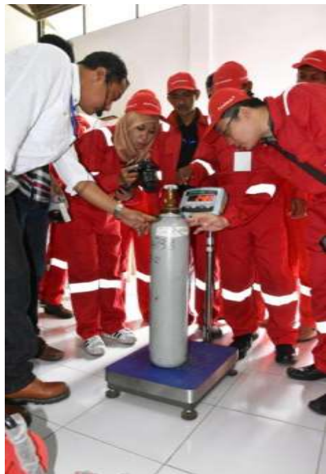
Gambar 12 Gas Sulphuryl Fluoride dalam bentuk tabung