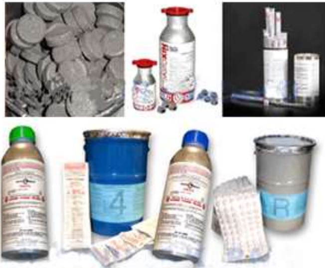
Gambar 13 Jenis fumigan PH3