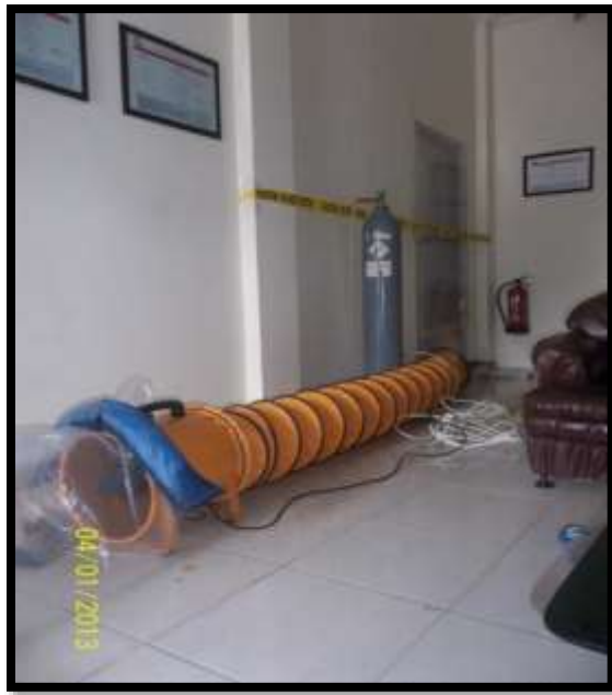
Gambar 9: Proses Aerasi